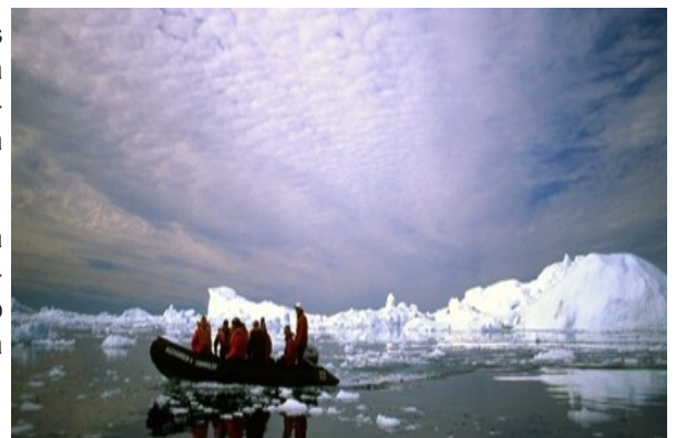
La pérdida de hielo marino en Disco Bay, Groenlandia.

El Grupo de Trabajo de composición abierta examinó también las alternativas a las sustancias que agotan el ozono en varios sectores, la demanda actual y futura de esas alternativas, sus costos económicos e implicaciones, así como los beneficios ambientales de evitar las alternativas para las SAO con potencial de alto calentamiento global. Las Partes solicitaron al Panel