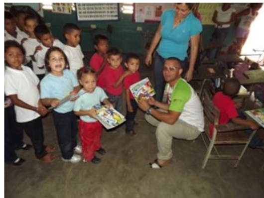
FONDOIN en la Escuela Básica GC-15, El Banco, Altagracia de Orituco, Estado de Guárico.